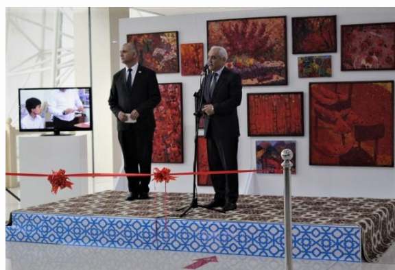
Джамшид Ганизода – ректор института дизайна и изобразительного искусства