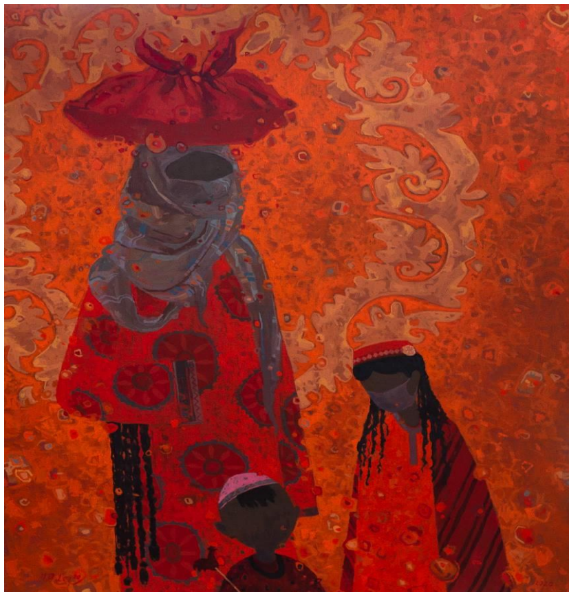
Работа № 2. «Праздник»

История написания этой картины связана с периодом распространения эпидемии ковида по всему миру. Было время, когда однажды запретили праздновать священный праздник – день завершения месяца Рамазан. В этот день дети по традиции посещают соседние дома, поздравляют с праздником и получают в подарок сладости, фрукты. Однако в период пандемии это было почти что запрещено.