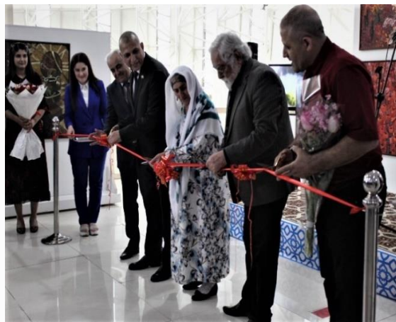
Церемония открытия выставки