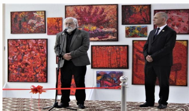
Выступление народного художника Таджикистана - Сабзали Шарипова