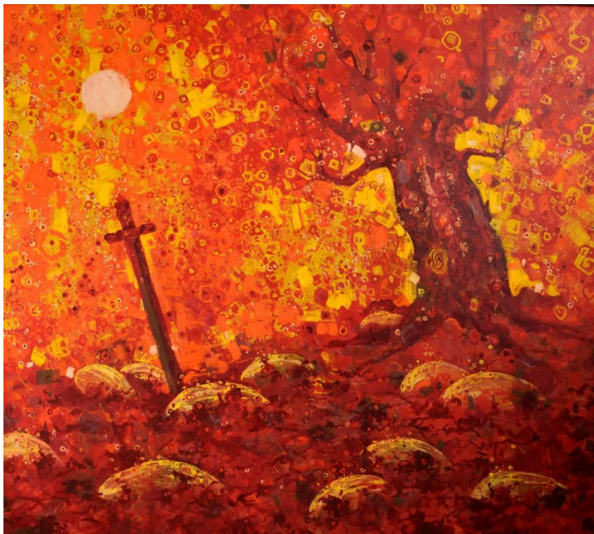
Работа № 3. «Тайна вкуса»

В этой очень оригинальной работе художник пользуется двумя элементами – это огромный меч, воткнутый в землю (образ мирного согласия, конца поединка) и огромное поле бахчевых (спелые дыни). По словам автора, он очень любит дыни, всегда ждет сезон их появления. В картине мы можем наблюдать как бы образ двух противоположностей – плодородной земли и орудия разрушения – меча.