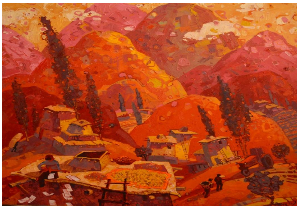
Работа № 1. «Незаконченный мотив»

Характеристика стиля работ художника Далера Михтоджева, выражалась в манерах экспрессионизма. Экспрессионизм — это направление в мировом изобразительном искусстве XX века, которое характеризуется к стремлению поиска гармонии. Художники-экспрессионисты стремились не воспроизводить окружающий мир, а передать зрителю собственное эмоциональное состояние с помощью формы и цвета. Они часто обращались к темам страха, разочарования, страдания, тревоги, боли и негодования, а для выражения этих сильных чувств использовали неровные линии, контрастные цвета, абстрактные формы, преувеличения и упрощения.