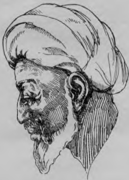
Абӯалӣ ибни Сино (980—1039) — яке аз фарзандони бузурги халқи тоҷик, барҷастатарин мутафаккири асрҳои миёна; дар қатори илмҳои дигар ба инкишофи астрономия низ саҳми арзанда гузоштааст.

Дар ин бора дар хотироти Ҷузҷонӣ «Рисолаи саргузашти Ибни Сино», як ишораи ҷолиби диққат ҳаст: «Дар «Мичастӣ»,— навиштааст ӯ,— даҳ шакл аз ихти-