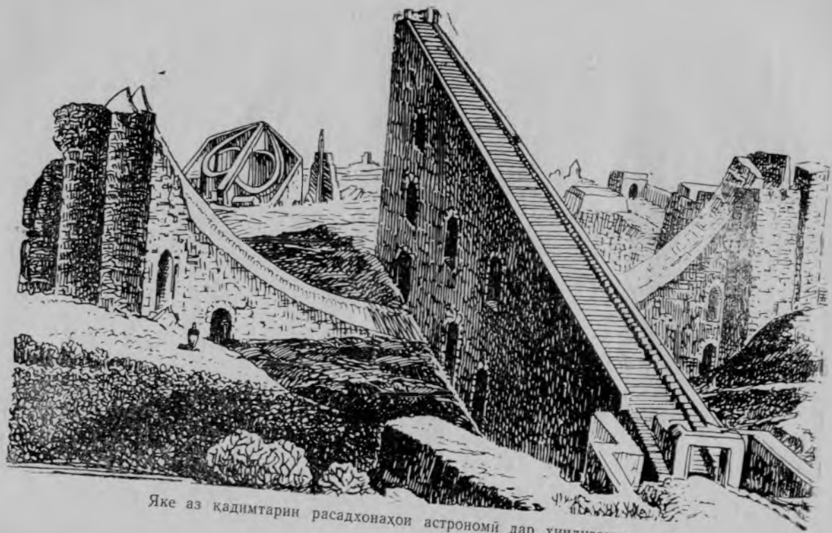
Яке аз қадимтарин расадхонаҳои астрономӣ дар Ҳиндустон.