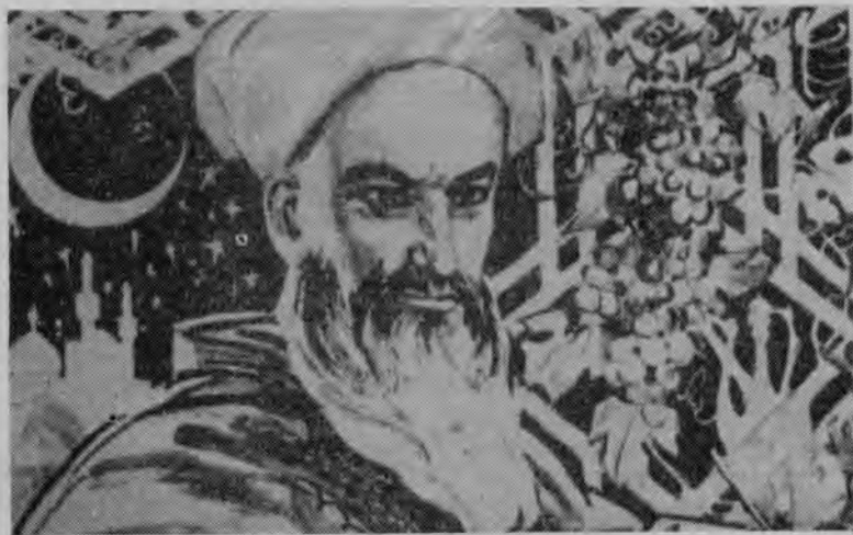
Умарӣ Хайём (1048—1131) — шоир ва олими маъруфи эронна- жод, ки махсусан дар таърихи астрономия ва математика ҷақиқ равшан гузоштааст.

Равияи дигари таҳқиқоти астрономие, ки онҳо астрономҳои Шарқи исломӣ пеша карда буданд, — мурабтаб-созии чадвалҳои нучум — зичҳо мебошад. Умуман