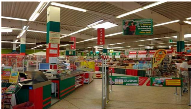
Супермаркет дар Олмон