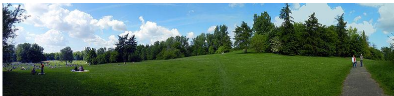
Боғи миллии Мариенберг