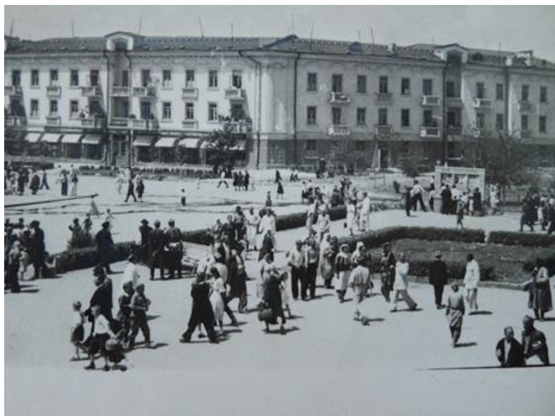
Кӯчаи 800-солагии Москва, соли 1961

Ба гирду атрофи боғи фарҳангию истироҳатӣ, ки ҳоло номи сардафтери адабиёти классикии тоҷик Абӯабдулоҳи Рӯдакиро гирифтааст, дида дӯхта ангушти ҳайрат мегазидам.