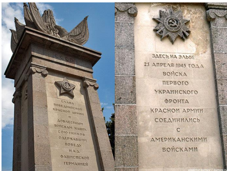
Лавҳаи таърихӣ дар дарёи Элба

Мо дар ин сафар бештар аз се ҳазор километр роҳро тай намудем. Аз рӯи маълумотҳо аз як тараф то тарафи дигари Олмон зиёда аз 1100 километрро ташкил медиҳад. Чанд маротиба ҳатто то мамлакатҳои Полша, Голландияю Белгия рафта, дар якчанд шаҳрҳои сайру саёҳат кардем.