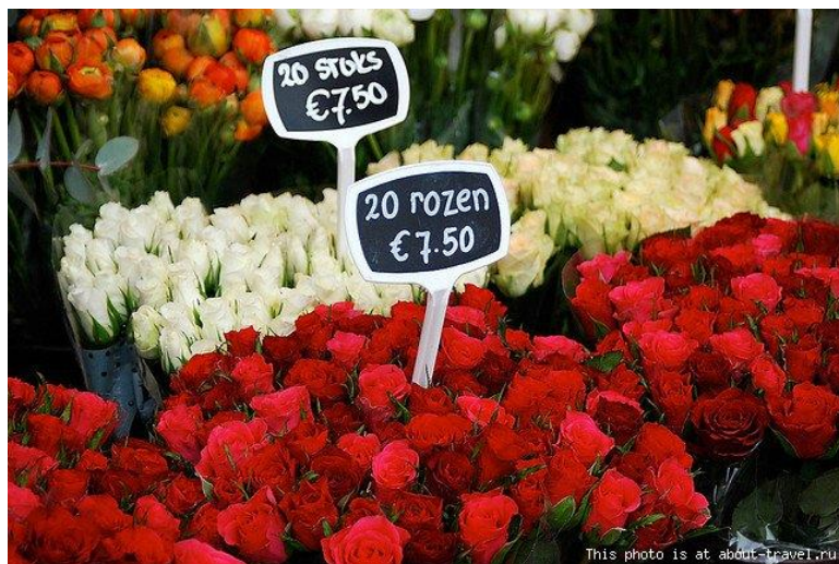
Бозори гулҳо дар Амстердам

Дар роҳраву кӯчаҳояш ҳазорҳо намуди гулу растани ба чашм мерасад, ки аз насими мулоими боди саҳарӣ ба димоғ бӯйи муаттарро меоваранд. Субҳгоҳон аз тамошои ин манзараҳо ҳаловат бурда, худро нисбатан ҷавону боққуват ҳис менамоӣ. Аз тамошои шаҳр лаззат бурдаму беихтиёр хиёбонҳои зебою дилкаши пойтахти Тоҷикистони азиз пеши назарам омад. Пойтахти мо низ дар зебоию дилкашӣ аз шаҳри Амстердам фарқе надорад.