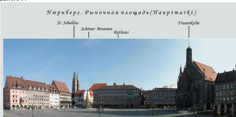
Майдони асоси шаҳр