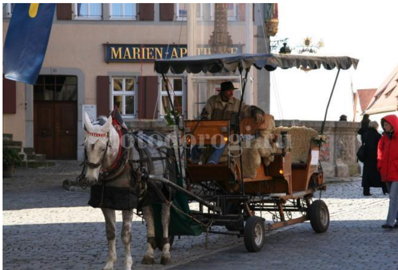
Фойтун дар Ротенбург

Вале дидам, ки олмониҳои дигар шаҳрҳо ин тухфаҳои ба мо нолозимро барои намоиши хонаҳояшон бо завқ харидорӣ менамоянд. Ба яке аз мағозаҳо даромадем, ки дар он тамоми яроқҳои оташфишон ба фурӯш гузошта шудаанд. Аз 200 евро сар карда то 8 500 евро нархгузори карда шудаанд. Ба ман таклиф намуданд, ки ягон намуди яроқро харидорӣ намоям. Рад кардам, зеро аниқ медонам, ки бурдани он ба Тоҷикистон ғайри имкон мебошад.