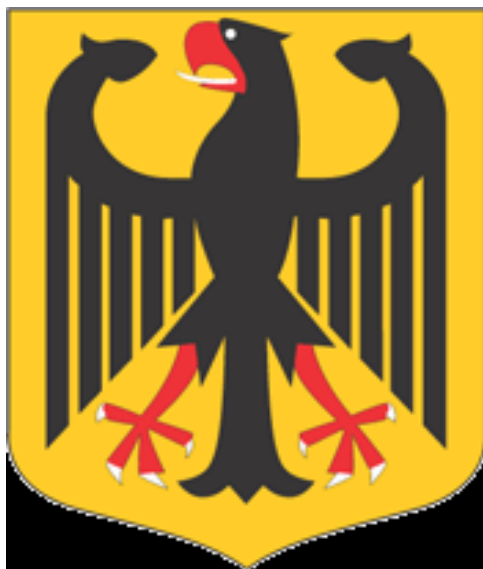
Парчам ва нишони Олмон