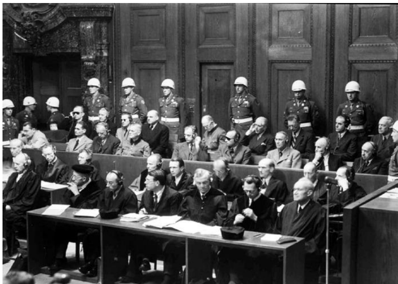
Мурофиаи трибунали ҷарбӣ дар Нюрнберг

Балдур фон Ширах ва Алберт Шпеерро ба муҳлати 20 сол, Вильгелм Фрик, Юлиус Штрайхер, Фриц Заукел, Артур Зейсс-Инкварт, Мартин Борман (ғоибона) ва Алфред Йоддро якумра, Рудолф Гесс, Валтер Функ, Эрих Редерро ба 20 сол аз озодӣ маҳрум намуд.