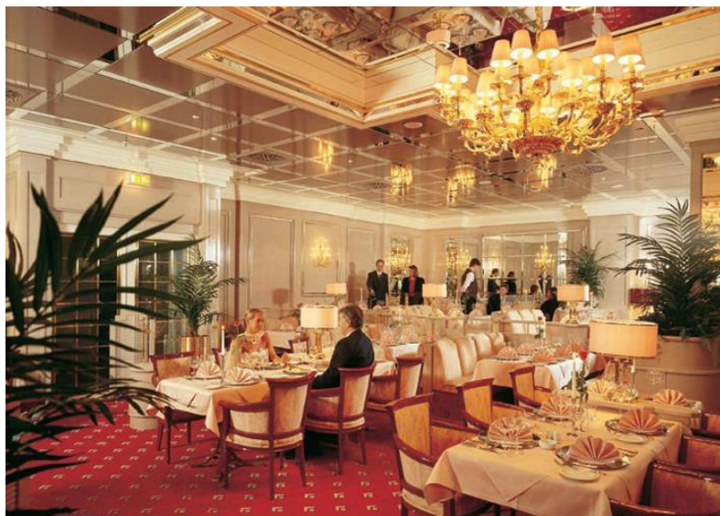
Тарабхона дар Олмон

– Сафар Саидович, ба воситаи тайёра бурдани ас-бобҳои рӯзгор қатъиян манъ аст. Худам харидорӣ карда, барои шумо мефиристонам.