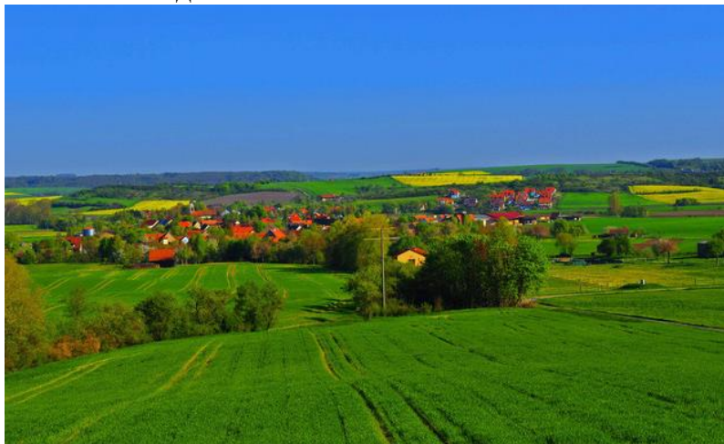
Заминҳои фермерӣ дар Олмон

мака, гандуму рапс кишт намудаанд. Дар ҳар 500-1000 метр хонаҳои истироҳатии фермерҳо ва заминҳои хушсифати корамнамудай онҳо ба чашм мерасанд. Бومي ҳамаи биноҳо бо шиферҳои сафолин пӯшонида шудаанд, ки аз тайёра хеле зебою назаррабо менамоянд.