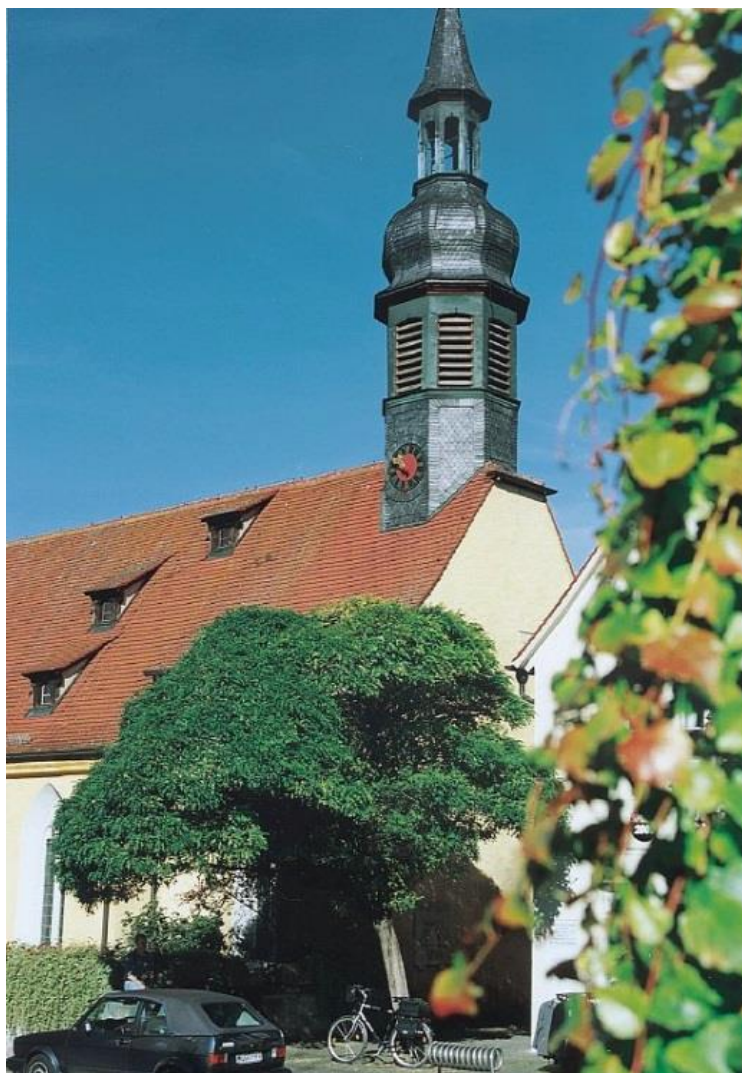
Гунсенхаузен (нем. Gunzenhausen) — шаҳрча дар Олмон замини Бавария. Аҳолиаш 16 ҳазор нафар. Масоҳаташ 82,73 км 2 .