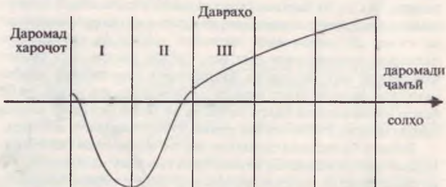
Нақшаи 4.1 Силсилаи ҳаётии маблағгузорӣ (11, с. 87).

Ин муаммо дар нақшаи зер чун тасвири силсилавии ҳаётии маблағгузорӣ нишон дода шудааст. (нигаред ба нақшаи 4.1).