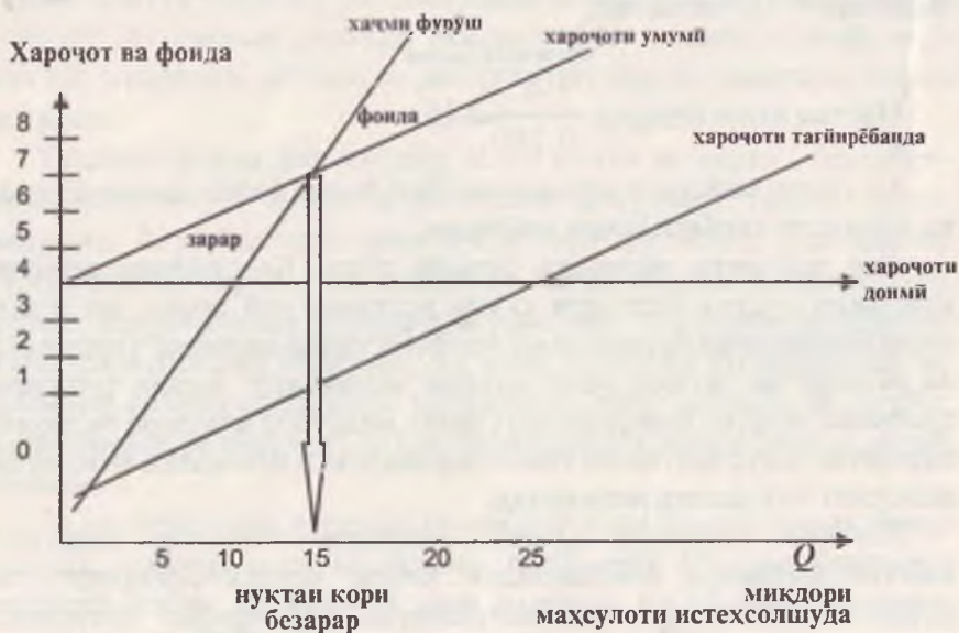
Нақшаи 11.1. Нуқтаи кори безарар. (11.с.132)

мегузаронанд, ки нуқтаи буриши он кори безарарро ифода намуда, онро ба ду майдон, яъне зарар ва фоида чудо менамояд.