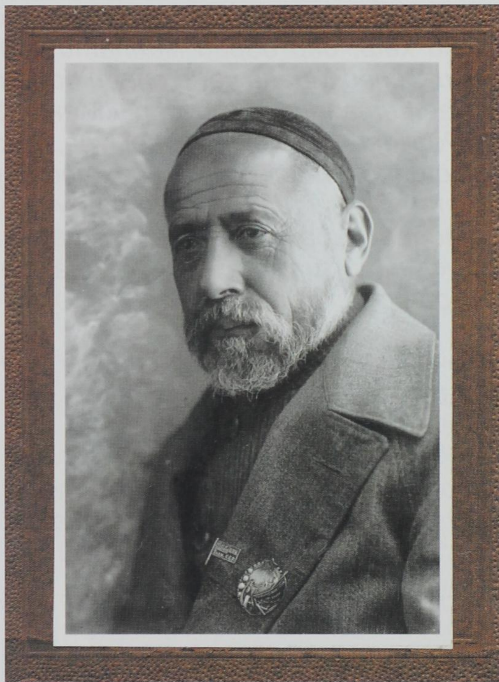
Садриддин Айни 1878 - 1954