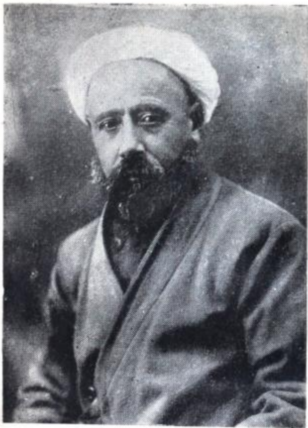
С. Айни, соли 1925.