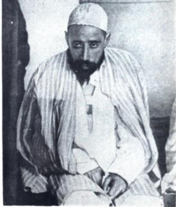
Сурати С. Айни дар беморхонаи Котон пас аз 75 рӯз зада шудани ӯ бо фармони амири Бухоро.

صَدِّقُ الرَّسُولِ مُحَمَّدِي بْنِ سَيِّدِ اَدْفُوَابِه