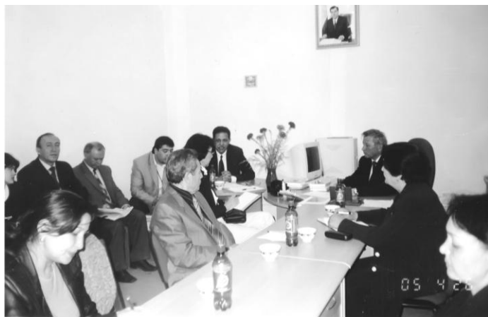
Встреча работников Центра с представителем Фонда народонаселения ООН.

ститут демографии Парижа, в Институт старения населения (Мальта), в Индию, в Германию и т.д. Устанавливались научные контакты с указанными научными центрами.