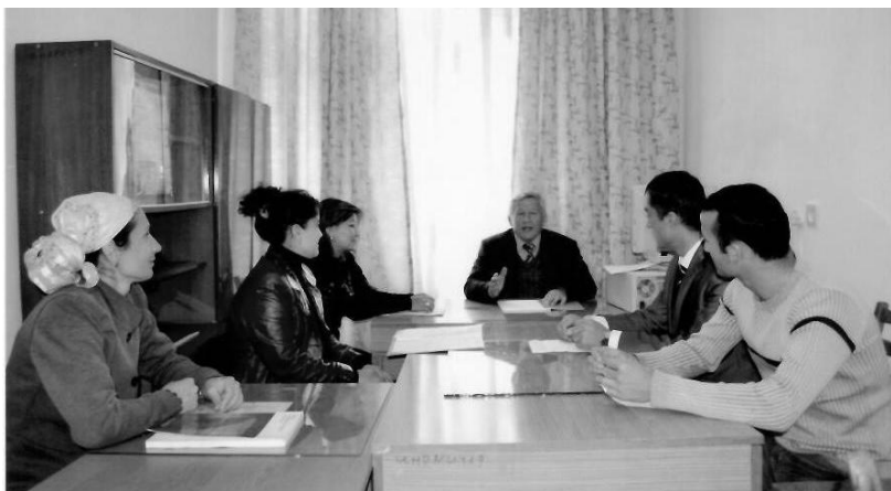
Подготовка к опросу населения

Для сбора первичной информации мы ежегодно проводили 2-3 социологических опроса среди городского и сельского населения Таджикистана.