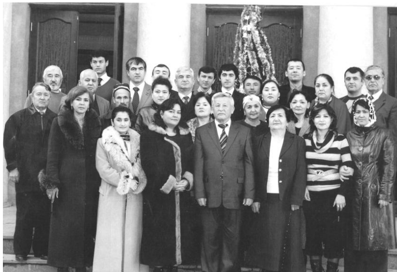
Коллектив Института демографии Академии наук РТ

По нашей просьбе по линии проекта приезжали специалисты из Мальты, Непала, Индии и других стран и читали лекции по современным демографическим проблемам.