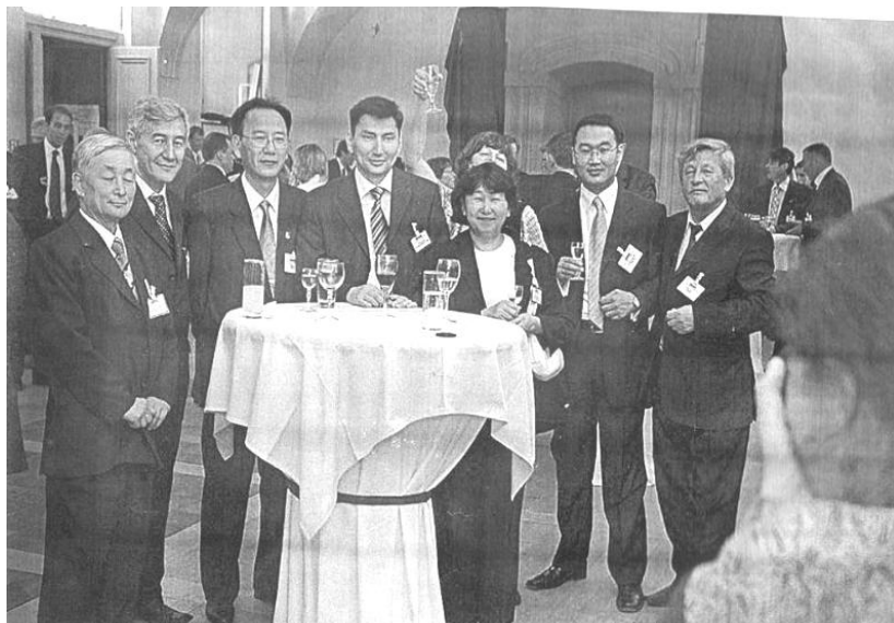
Участники Всемирной Пражской конференции во время перерыва (Прага, 2005г.)