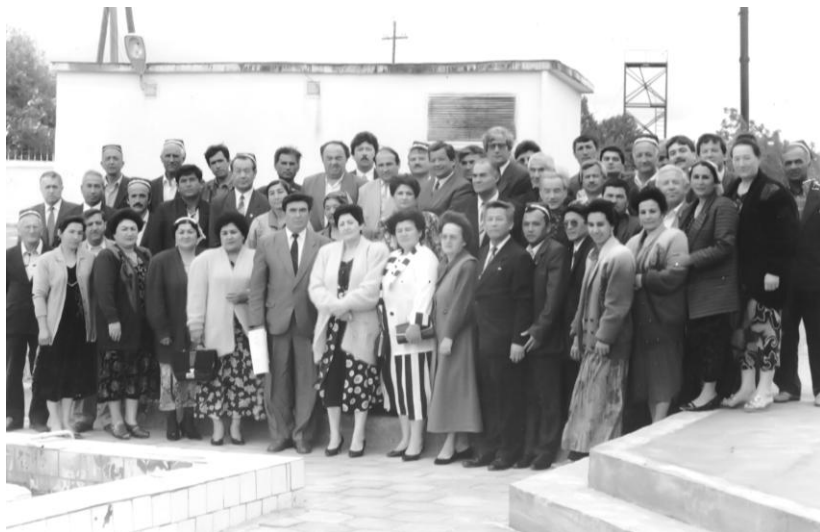
Участники первой страновой конференции по программе «Sprite» в г. Душанбе, 1996г.

Согласно этому проекту, мы прошли обучение в г. Душанбе, в Ташкенте, в Москве и США. Слушателями были представители из стран Центральной Азии, Кавказа и Монголии. После завершения обучения у нас сформировалась страновая команда, которая должна была в своих странах проводить конференции и круглые столы по вопросам реформирования социальной сферы на рыночный лад.