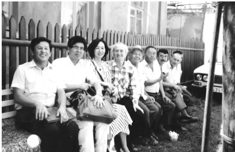
Японские специалисты из университета Хоккайдо во время отдыха, 1999г.

пил Президент Республики Таджикистан Э. Рахмон с речью на тему: «Планирование семьи – гарантия устойчивого развития общества».