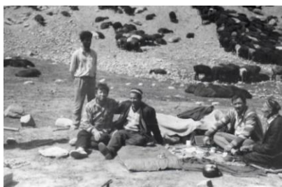
Опрос в Ягнобе в поселении древних согдийцев (2008 г.)