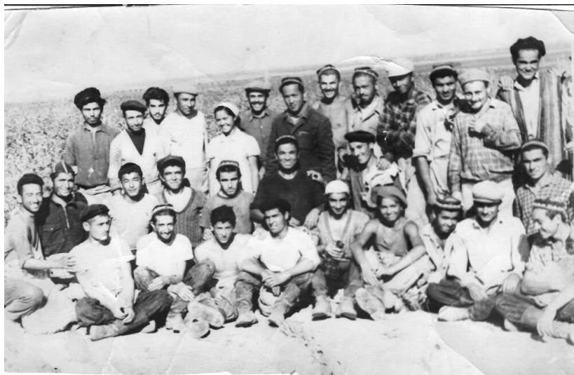
Студенты 3-го курса дневного обучения на сборе хлопка

Меня избрали руководителем научно-студенческого кружка кафедры политической экономии, а через пару месяцев - председателем СНО 1 экономического факультета.