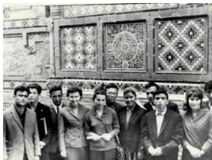
Участники научно-студенческой конференции университетов Средней Азии и Казахстана знакомятся с архитектурными памятниками, г. Самарканд