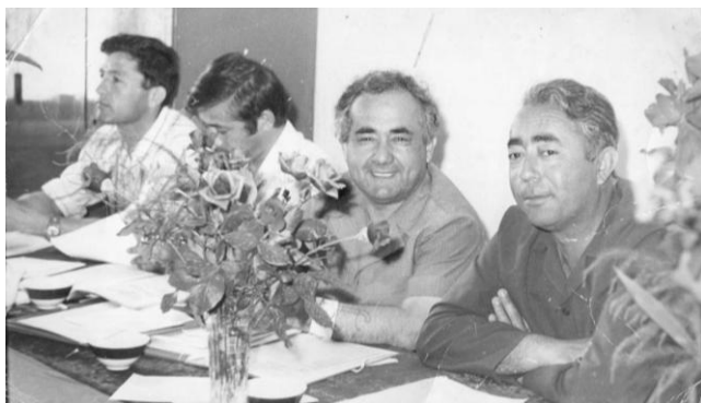
Прием государственного экзамена у студентов-выпускников экономического факультета ТГУ им. В.И. Ленина

После завершения учебы в университете, в 1966 г. я поступил на работу в Институт экономики Академии наук Республики Таджикистан на должность младшего научного сотрудника.