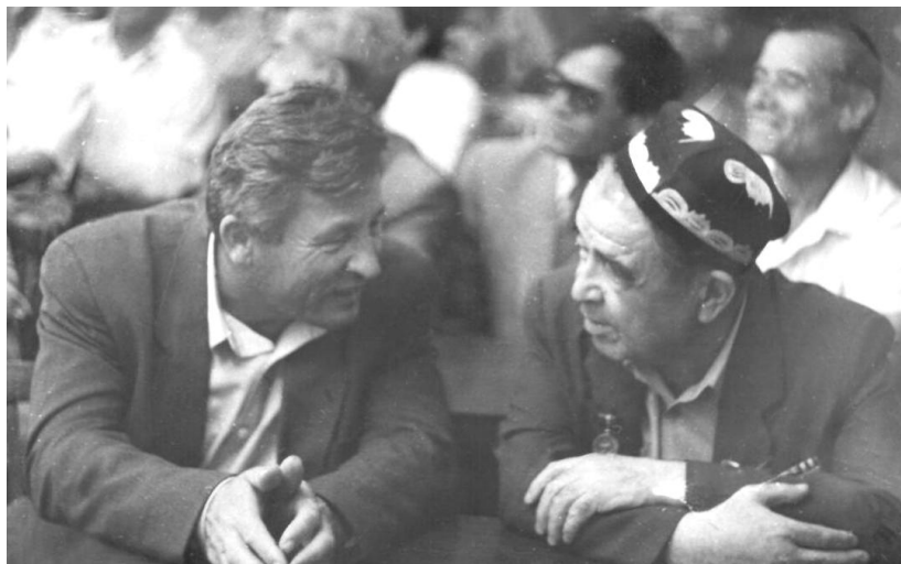
Беседа Рачаба Амонова - академика АН РТ, с Исламовым С.И.

Наши научные контакты расширились. Приезжали ученые из России, Японии, США, Франции, Мальты, Непала и других стран. Мы обогащали свои знания. Я старался привлекать к совместным исследованиям ученых-филологов, математиков, географов, историков, этнографов, медиков и т.д., ибо диапазон направлений демографических исследований был широк.