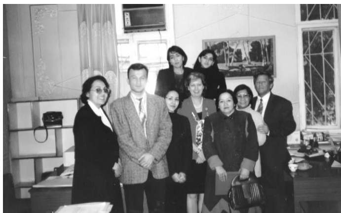
Встреча коллектива Центра народонаселения с представителями Фонда народонаселения ООН из Америки и Мальты.