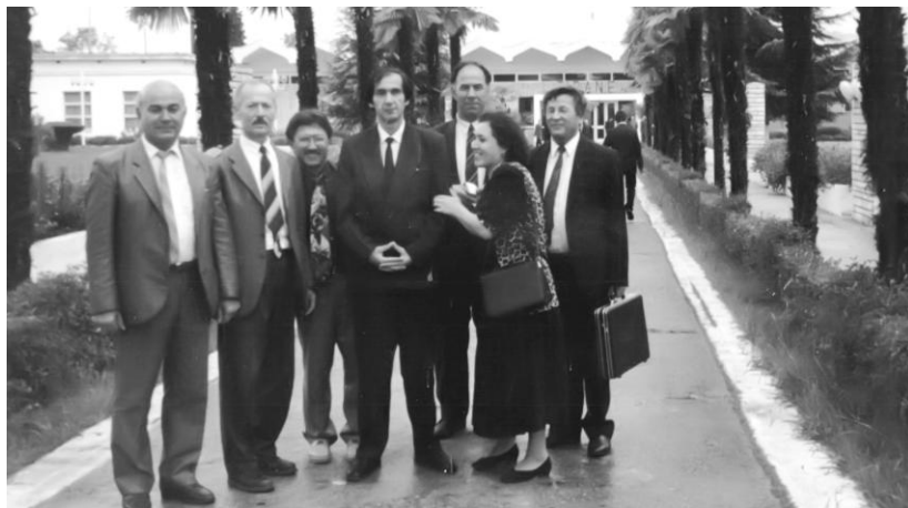
Таджикская делегация в Албании для изучения опыта создания «Социально-инвестиционного Фонда». (1999 г.)

им. М.В. Ломоносова, с Институтом демографии ВШЭ г. Москвы, с Кыргызско-Российским (славянским) университетом и т.д. За короткое время (2003-2010гг.) мы подготовили 15 кандидатов наук по специальности «Экономика народонаселения и демография».