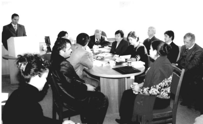
Конференция в Институте демографии