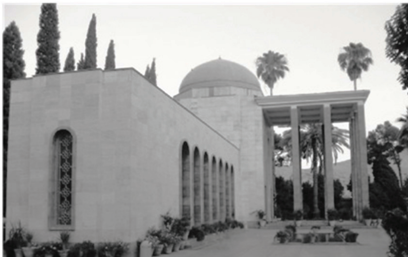
Мақбарои Саъдӣ дар Шероз