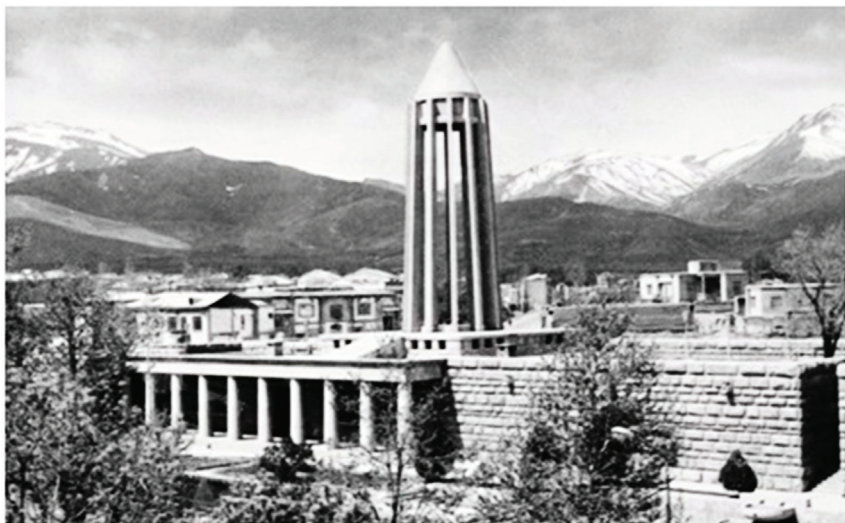
Мақбараи Сино дар Ҳамадон

нун», «Китоб-уш-шифо», «Донишнома» барин асархояш чандин аср дар мамлакатҳои Шарқ ва Ғарб ҳамчун китоби дарсӣ ба толибилмон хизмат кардаанд. Ҳоло ҳамчун намуна чанд нақлу ривоятҳои халқиро меорем.