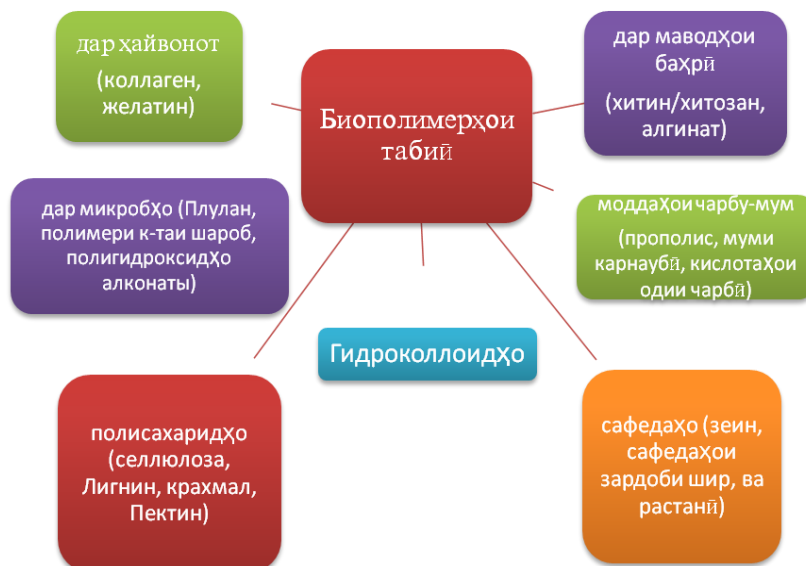
Расми 2. Биополимерҳое, ки барои болопӯш ва банду бастаи маводи хӯрока ва доруворӣ истифода мешаванд

Масолеҳҳои биополимерӣ, ки аз манбаъҳои табиӣ гирифта мешаванд ва ҳамчун масолеҳҳои композитсионӣ дар намуди плёнкаву рӯйпӯшҳо истифода мешаванд, дар расми 2 оварда шудаанд.