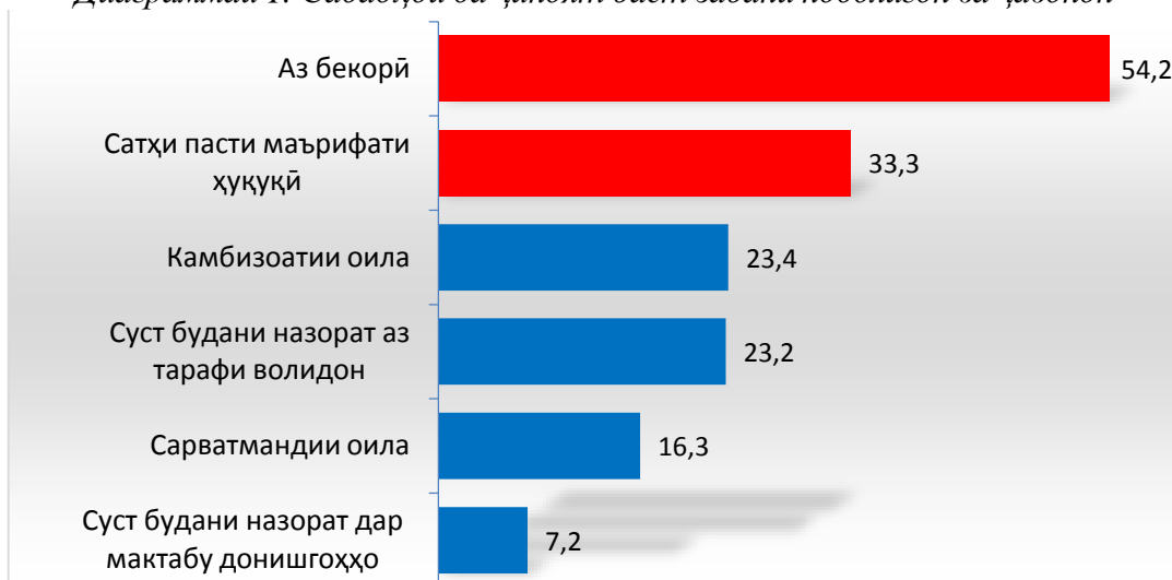
Диаграммаи 1. Сабабҳои ба ҷиноят даст задани ноблигон ва ҷавонон

Дар рафти мусоҳиба аз мутахассисони соҳаҳои мухталифи қор бо ҷавонон пурсида шуд, ки то онҳо сатҳи дониши ҳуқуқии ҷавони маҳалашонро баҳогузорӣ намоянд. Таҳлилҳои нишон доданд, ки 54,6% ҷавобдиҳандаҳо сатҳи дониши ҳуқуқии ҷавонони маҳалашонро дар сатҳи миёна, 29,4% дар сатҳи паст, 6,7% дар сатҳи зарурӣ арзёбӣ намуданд ва 4,2% қайд намуданд, ки дар замони ҳозира дониши ҳуқуқӣ лозим нест. Аз натиҷаи таҳлил чунин хулоса баровардан мумкин аст, ки қисми зиёди ҷавобдиҳандагон дониши ҳуқуқии ҷавононро дар сатҳи миёна баҳогузорӣ намудаанд.