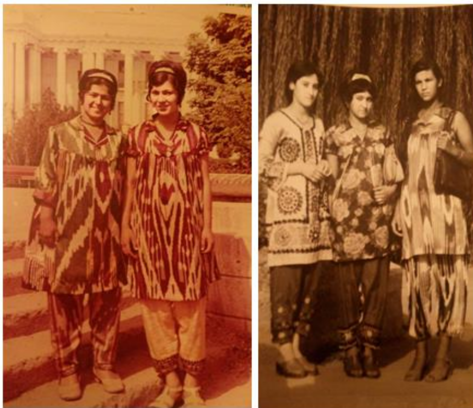
Илл. 1. Стили на основе платья «бурма курта»