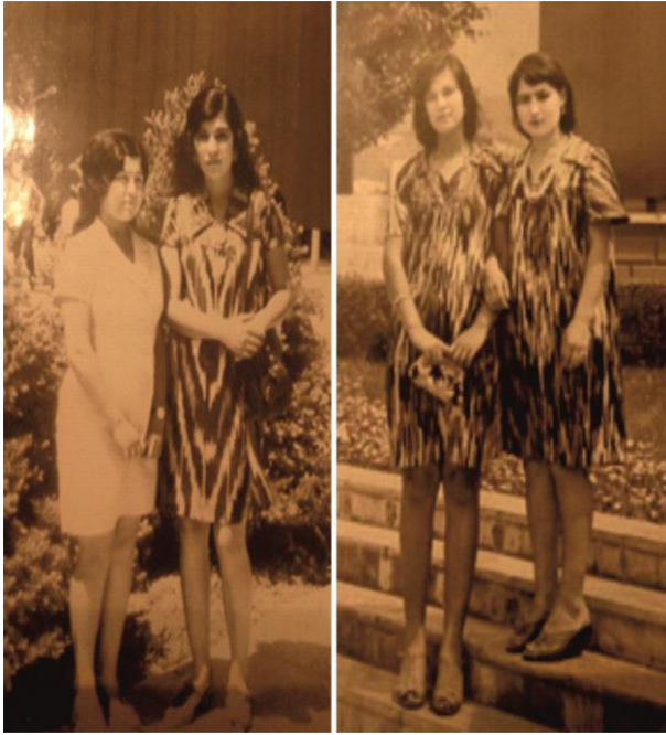
Илл. 2. Реализация в традиционных платьях стиля «мини»