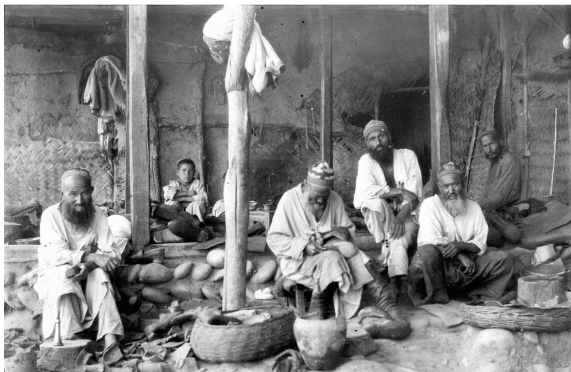
Илл. 2. Повседневная одежда памирских горцев. Начало XX века