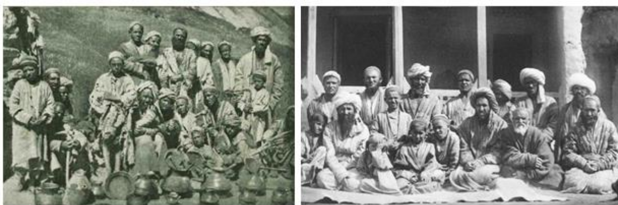
Илл. 1. Повседневные костюмы жителей селений Пискон (слева) и Навабад. Ягноб. 1896 год