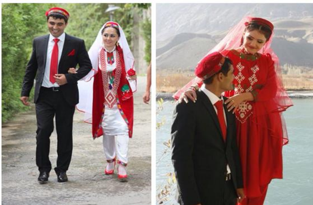
Илл. 1. Примеры свадебных нарядов таджиков Памира.