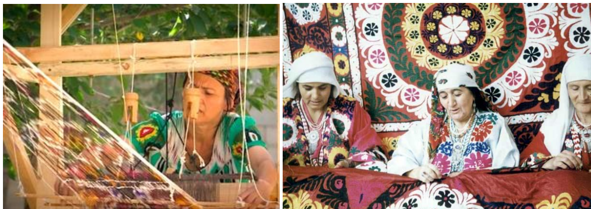
Илл. 1. Народные мастерицы за работой. Душанбе, наши дни

Безусловно, очередной год в Таджикистане станет периодом подъема ремесленничества и возрастания интереса жителей к народным промыслам, как важной составляющей национальной культуры.