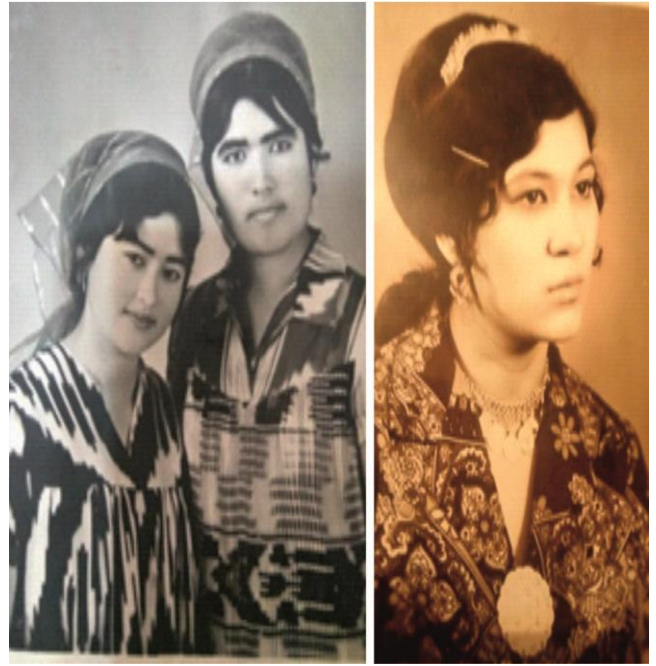
Илл. 3. Слева - использование в нижней части «бурма-курта» фасона «плиссе»; справа – вариант модной прически