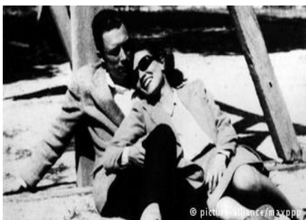
А.Камю ва Франсис Камю соли 1942