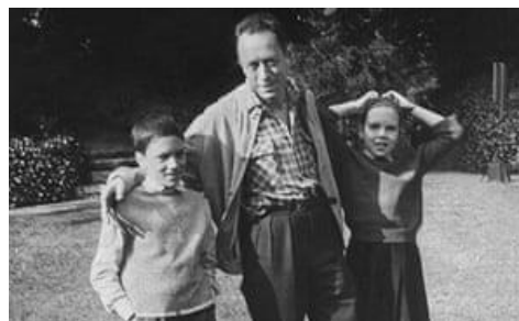
Камю бо фарзандонаш