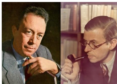
Алберт Камю ва Ж.П.Сартр