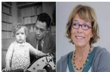
Алберт Камю бо духтараш Катерин