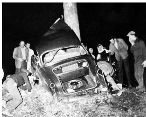
Тасодуфе, ки сабаби марги Камю шуд