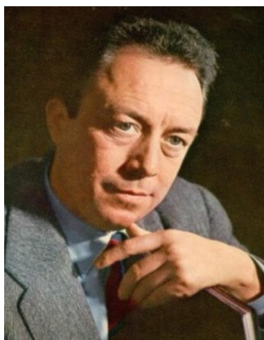
Алберт Камю (1913-1960)