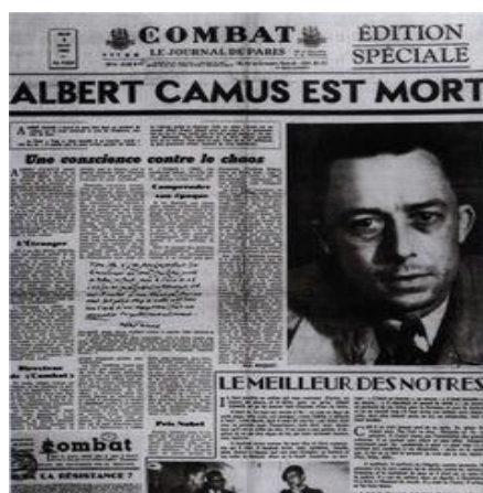
Марги Камю муҳимтарин сарлавҳаи рӯзномаҳо