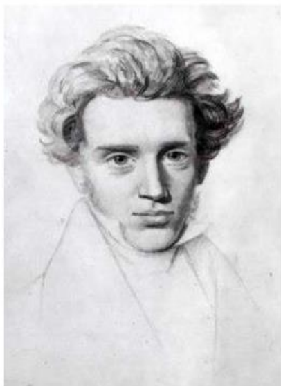
Сёрен Керкегор (1813-1855)