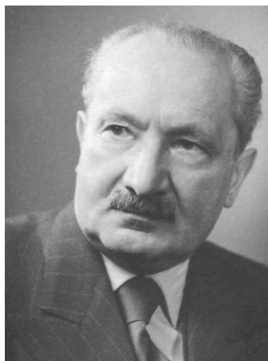
Мартин Хайдеггер (1889–1976)

Ҳодисаҳои ҷузъӣ ҷараёни экзистенциализмро кумак намуданд ва қудрат бахшиданд. Дар романи “Бародарон Карамазовҳо” навиштаи Достоевский (1880) Иван муоризачӯӣ ва эътирози ҳайратовареро дар фалсафа матраҳ кард: “Агар Худо набошад, пас ҳама чиз маҷоз ва мумкин аст”. Ин сухан ба ин маъност, ки қоидаҳои ахлоқӣ бидуни пуштувонаю заминаи эътиқодӣ, назорат ва кайфару ҷазои илоҳӣ, беасар ва бетаъсир хоҳад буд. Магар он ки бар ҳар инсон ниғаҳбоне гуморида ва таъин карда шавад, ки он ҳам таҳаммулнопазир аст. Ин