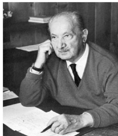
Мартин Хайдеггер (1889–1976)