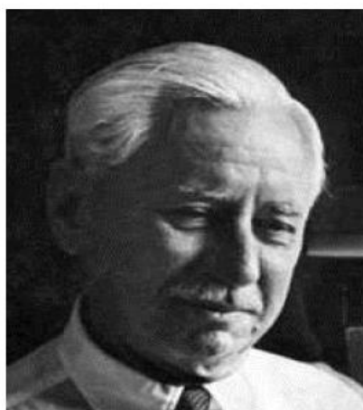
Вил Дюрант (1885–1981)