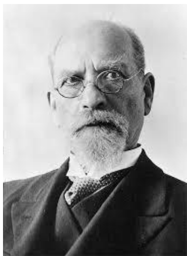
Эдмунд Хуссерл (1859–1938)