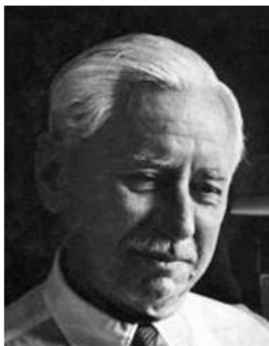
Вил Дюрант (1885–1981)

Вил Дюрант файласуф ва муҳаққиқи сатҳи ҷаҳонии Амрикоист. Осори ӯ чун “Дарсҳое аз таърих”, “Таърихи фалсафа”, “Лаззатҳое аз мутолиаи фалсафа” ва китоби 27 ҷилдаи “Таърихи