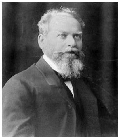
Эдмунд Хуссерл (1859–1938)