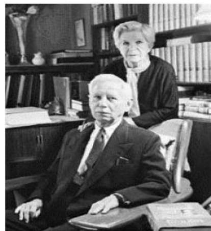
Вил Дюрант ва Ариэл Дюрант (1885–1981) (1898–1981)