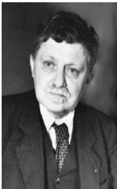
Габриэл Марсел (1889-1973)