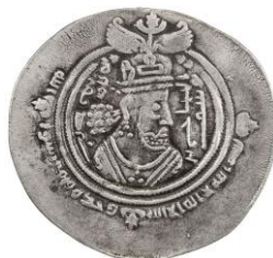
Акси 2. Дирхами Ҳачҷоч ибни Юсуф.