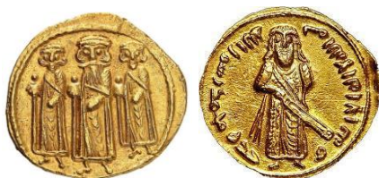
Акси 1. Динори Абдулмалик ибни Марвон.

Ҳамин тавр, Балозурӣ таърихи сикказании исломиро дар тақя бо нақли дигарон инъикос намуда, низоми вазнии арабҳоро дар давраи тоисломӣ, гардиши сиккаҳои сосонӣ ва румӣ дар ин давра, таъсири анъанаҳои сикказании сосонӣ ва румии шарқӣ ба шаклгирии сикказании исломӣ ва муомилоти ули он, тавсифи таносуби вазн ва қурби сиккаҳои гуногун, намудҳои гуногуни вазн ва сиккаҳои гуногуни роиҷи даврони умавиро инъикос намудааст. Аммо ӯ доир ба риоя нашудани талаботи қонунгузории исломӣ доир ба истифода нашудани тасвири мавҷудоти зинда ва рамзҳои тоисломӣ дар сиккаҳои исломӣ аз ҷониби халифаҳо ва ҳокимон ҳарфе нагуфтааст.