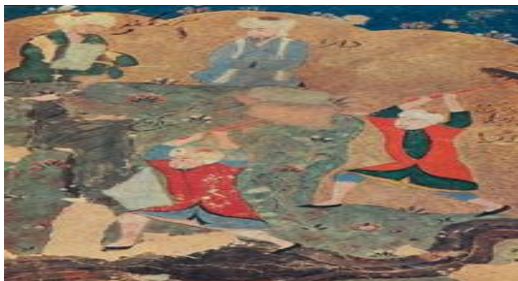
Рис.1. Искандар на переправе через Сырдарью. Миниатюра. Максуд ибн Осман-и Кухистани. «Таърихи Абулхайрхани» («История Абулхайрхана»). Рукопись ИВ АН Узбекистана, 9989, л.66. 1540-е гг. Самарканд.