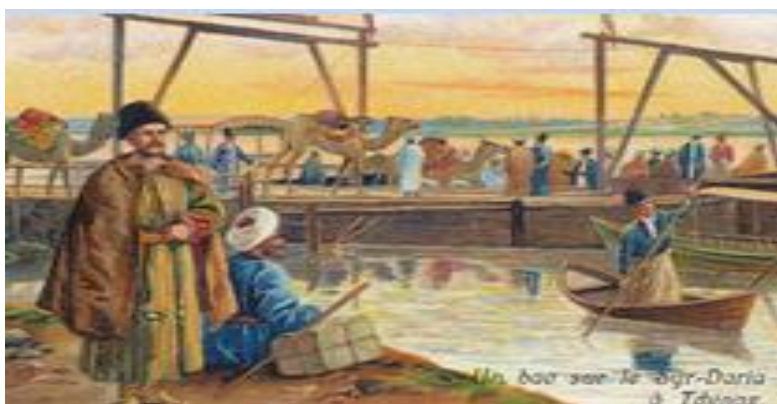
Рис.2. Чиназ. Пристань на берегу Сырдарьи. Почтовая карточка. 1904 г.