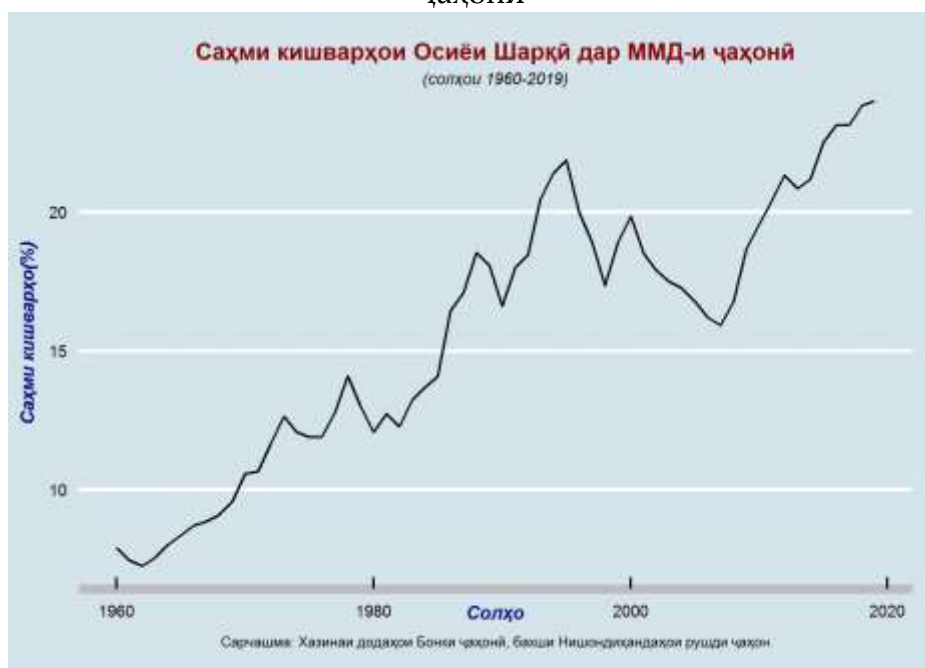
Расми 8. Саҳми кишварҳои Осиёи Шарқӣ дар ММД-и ҷаҳонӣ

Аз намудори боло ба осонӣ дида метавонем, ки саҳми кишварҳои Осиёи Шарқӣ дар ММД-и ҷаҳон аз соли 1963 инҷониб пайваста зиёд шудааст. Агар дар соли 1960 саҳми ин минтақа дар иқтисоди ҷаҳонӣ ба 7.89 дарсад баробар буд, онҳо тавонистанд онро дар соли 1980 ба 12.07 дарсад, дар соли 2000-ум ба 19.84 дарсад ва саранҷом дар соли 2019 ба 24 дарсад расонанд. Танҳо дар даврони бӯҳронҳои иқтисодии муайян ин сатҳ каме пойин меравад, вале дар даврони оромӣ пайваста зиёд мешавад. Дар солҳои 1970 ва 1980-ум дар пайи ҷаҳиши нархи нафт поён меравад ва дар аввали солҳои навадум каме пастшавии он ба рукути иқтисодии Ҷопон рабт дорад. Дар замони Бӯҳрони молиявии Осиё (1997) ин нишондиҳанда коҳиши назаррасро дорад. Баъдан дар солҳои 2003 то 2008